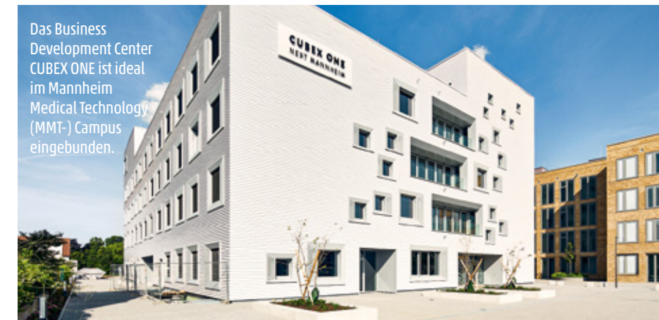
Das Business Development Center CUBEX ONE ist ideal im Mannheim Medical Technology (MMT-) Campus eingebunden.

Seit über zehn Jahren bildet Mannheim mit dem Mannheim Medical Technology Cluster einen starken Schwerpunkt für Medizintechnologie in der Region.