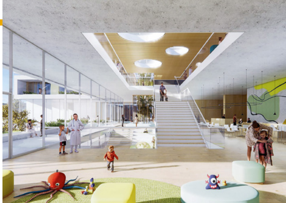
Das Heidelberger Hopp-Kindertumorzentrum Heidelberg wird neu gebaut, um noch bessere Forschungs- und Behandlungsvoraussetzungen zu schaffen.

In und um Heidelberg und Mannheim wachsen Know-how und Unternehmertum rasant.